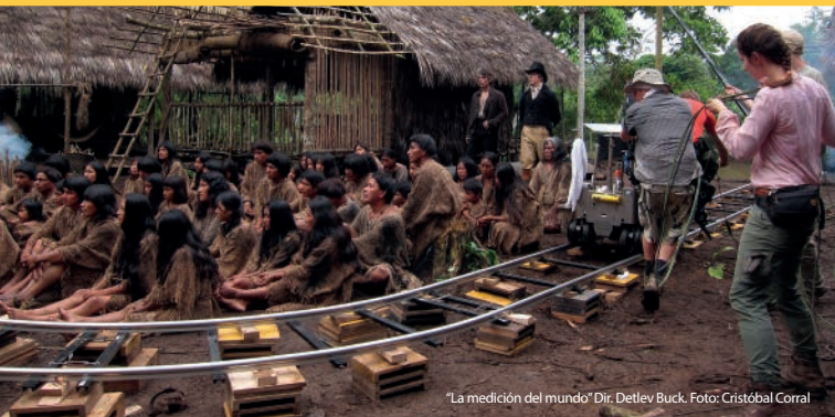
"La medición del mundo" Dir. Detlev Buck.