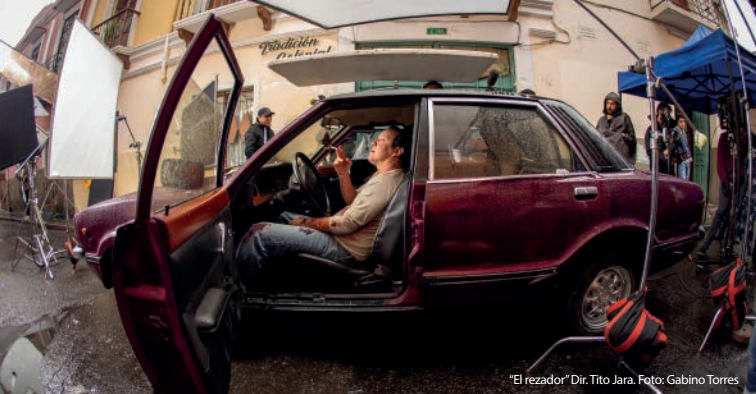
"El rezador" Dir. Tito Jara.