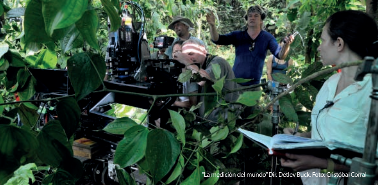
"La medición del mundo" Dir. Detlev Buck.